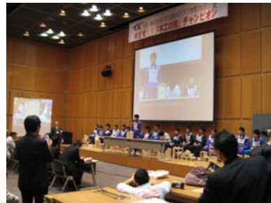
作品のプレゼンテーションの様子