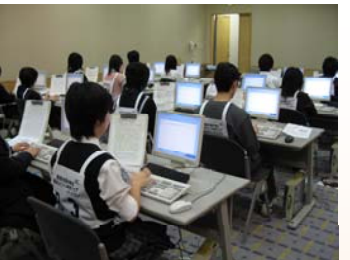
競技開始を待つ緊張の一瞬