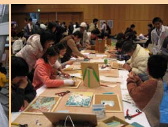
体験コーナーはどこも、大盛況でした。