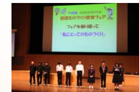
文部科学大臣奨励賞受賞者によるフェアを振り返っての一言

今回のフェアは、会場を東京都足立区のTHEATRE1010(シアターセンジュ)にて開催いたします。是非、多くの皆様のご参加・ご参観をお待ちしております。