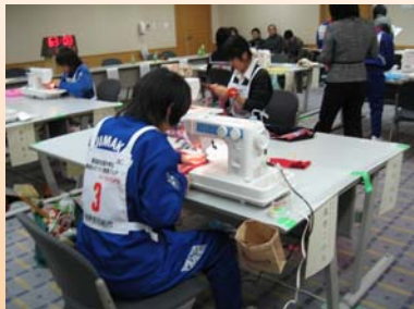
ミシンを使った製作の様子

全国から選抜された16名の選手が、4時間の競技時間でアイデアハーフパンツを製作しました。ファッションショーでは、自らモデルとなり、作品の機能やデザインをアピールしました。