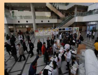
エントランスは、多くの人でにぎわっていました。

また、多くの協賛企業様・団体様に無料体験コーナーや展示ブースを設置していただき、ものづくりの楽しさや、ものづくりに携わる多くの人たちの英知や技を実際に見たり、体験する事ができました。