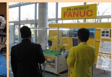
サッカーロボットが目を引いていました。