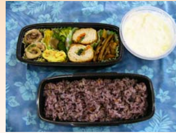
できあがったおべんとう