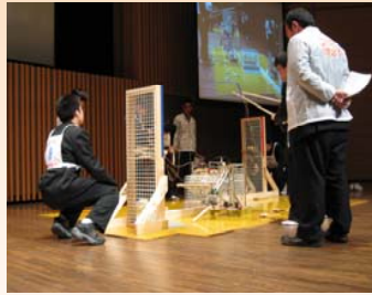
B部門の競技の様子