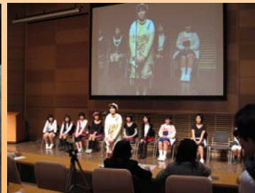
ファッションショーの様子