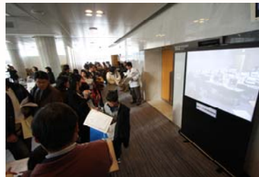
会場内の中継を見る引率者

コンピュータ活用の基礎・基本とも言うべきパソコン入力（タッチタイピング）を、全国予選大会から上位188名が集まり、準決勝、決勝（68名）でその素晴らしい技術を競い合いました。また、今回初めて「あなたのためのメールコンテスト」を実施しました。