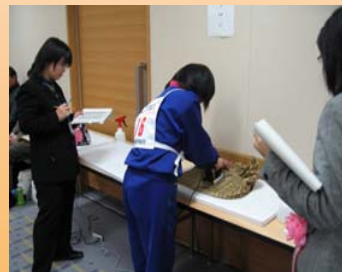
競技中の真剣な参加者と審査委