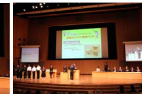
閉会式での表彰式