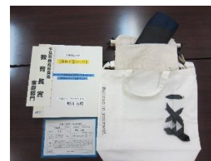
県教育長賞作品【技術分野・家庭分野】